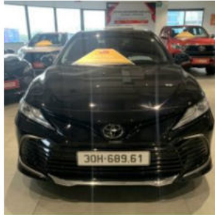
Toyota Camry đã qua sử dụng 455,000,000 đ