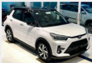
Toyota Raize 552,000,000 đ