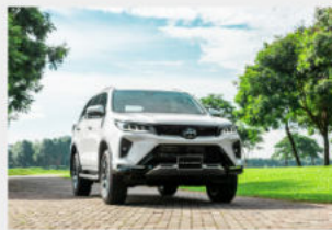
Toyota Fortuner 1,118,000,000 đ