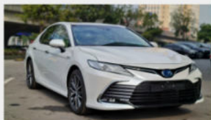
Toyota Camry 1,070,000,000 đ