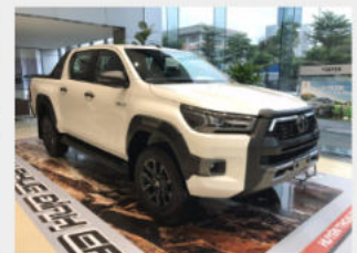
Toyota Hilux 852,000,000 đ