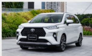
Toyota Veloz 658,000,000 đ