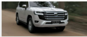
Toyota Land Cruiser 4,286,000,000 đ