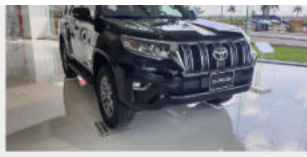
Toyota Land Cruiser Prado 2,628,000,000 đ