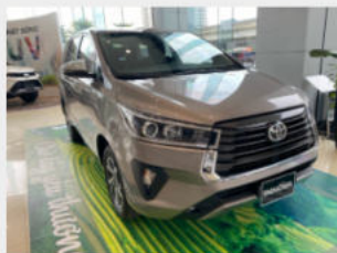
Toyota Innova 755,000,000 đ