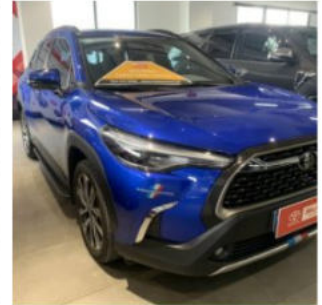
Corolla Cross 1.8V 2020 865,000,000 đ