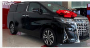
Toyota Alphard 4,370,000,000 đ