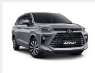
Toyota Avanza 558,000,000 đ