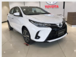
Toyota Yaris 684,000,000 đ