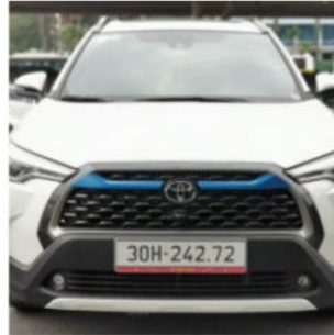
Cross 1.8 V 2021 910,000,000 đ