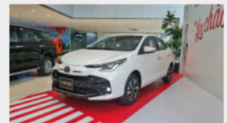
Toyota Vios 528,000,000 đ