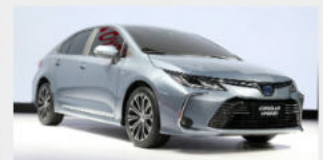
Toyota Corolla Altis 719,000,000 đ