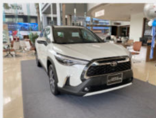
Toyota Corolla Cross 846,000,000 đ