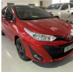
Vios E CVT biển tỉnh 502,000,000 đ