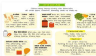
BMI - Béo phì độ III