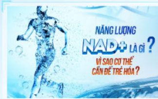
Năng Lượng NAD+ Giải Pháp Nâng Cao Và Bảo Vệ Sức Khỏe...