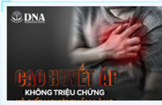
Những Biểu Chứng Nguy Hiểm Khi Không Điều Trị Tăng Huyết Áp