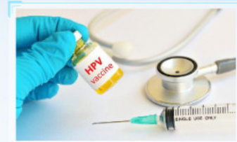
Phòng Chống Ung Thư Cổ Tử Cung – Kỳ 6