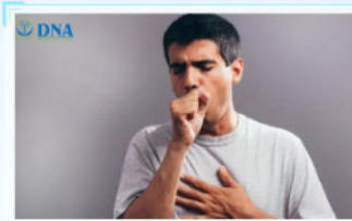
Những Căn Bệnh Ung Thư Đáng Sợ Ở Nam Giới